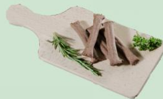
Frischfleischsticks o. Verpackung